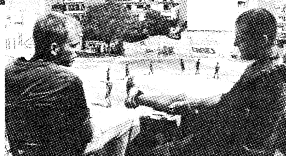
«Tungsten» του Γιώργου Γεωργόπουλου.

Οι ταινίες μεγάλου μήκους που θα διαγωνιστούν για τη Χρυσή Αφροδίτη επιλέχθηκαν μέσα από μία λίστα εξαιρετικών δημιουργιών απ' όλο τον κόσμο. Όλες είναι πρώτες δημιουργίες των σκηνοθετών τους, γεγονός που τις καθιστά ξεχωριστές και αξιοπρόσεκτες. Οι ταινίες, που κατάφεραν ήδη την πρώτη τους διάκριση στο φεστιβάλ, πετυχαίνοντας να θέσουν στην τελική ενδεκάδα, προέρχονται από Ελλάδα, Κύπρο, Ρουμανία, Ιταλία, Αρμενία, Αζερμπαϊτζάν, Γερμανία, Βέλγιο, Αλβανία, Αλβανία και Σερβία. Πρόκειται για τις ταινίες «Χάραμα πάνω από τη λίμνη Βαν» του Αρτζάν Ιγκιτιάν, «Η Περιφέρεια» του Ίλγκαρ Σαφάτ (Αζερμπαϊτζάν), «Marieke, Marieke» της Σόφι Σάουκενς (Βέλγιο), «Παραμυθιστικό» του Ελευθέ-