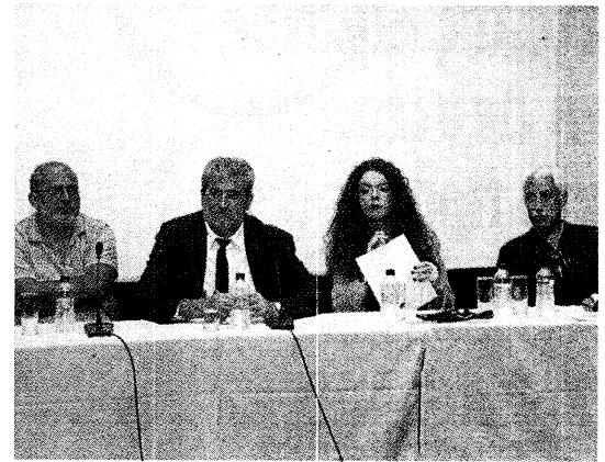
Στη συνέντευξη Τύπου χθες παρουσιάστηκε το πλήρες πρόγραμμα του Φεστιβάλ